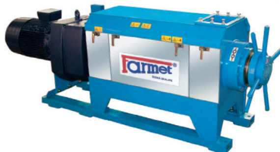
Presele melc Farmet L 200