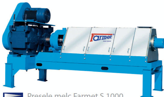
Presele melc Farmet S 1000